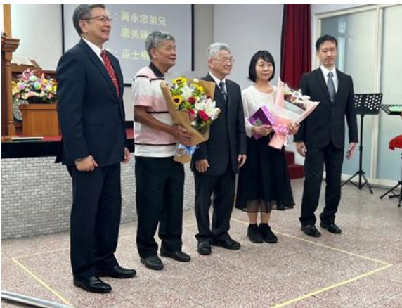
2024 年洗禮與慶祝受洗福音茶會