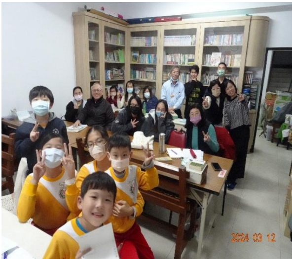
日語最後一堂課-團體照