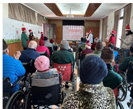
仁愛之家聖誕佈道