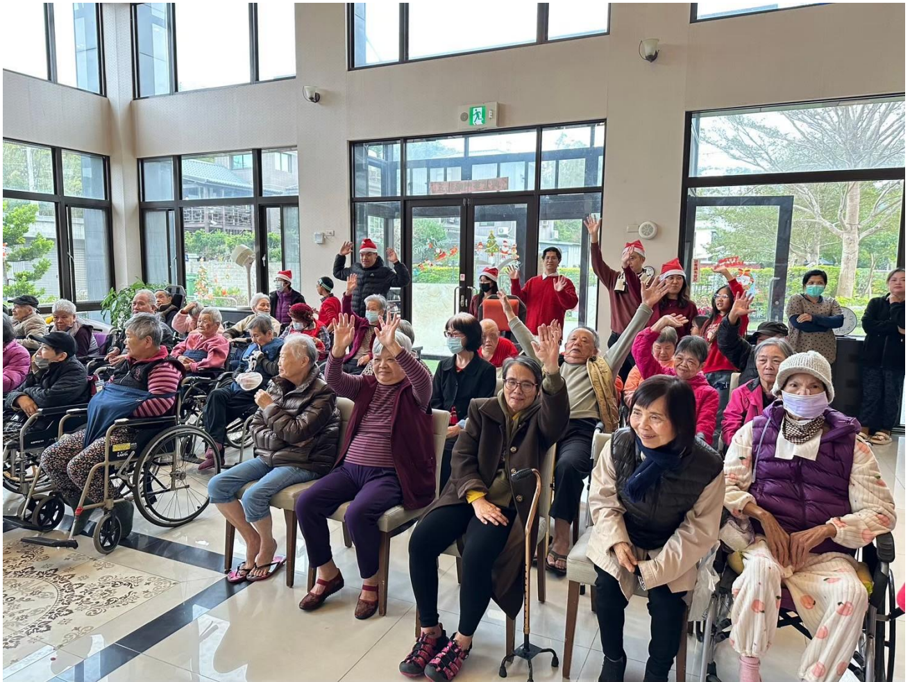
12/15 兒主/青少年聖誕福音行動芊馨園報佳音