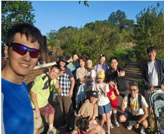
主日下午秀才步道散步