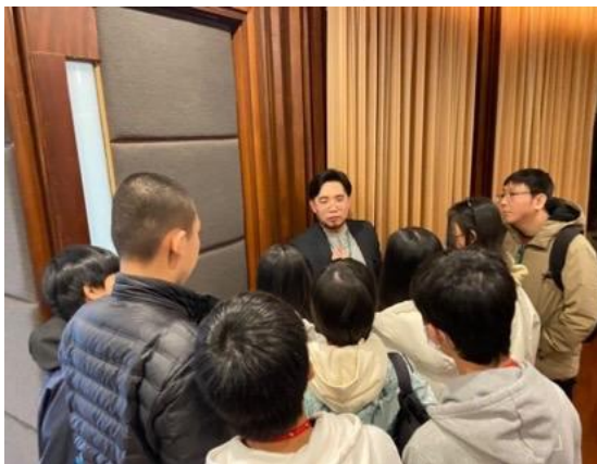
柏佑傳道帶領青年營會

主耶穌，若祢願意，求祢使用我成為家人的祝福，也讓家人們藉著我看見神祢的作為，也接受祢是他們的主，阿們。