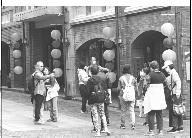
宜蘭傳藝中心一日遊 2