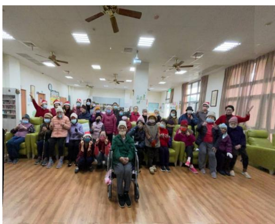
慈濟日照中心聖誕佈道