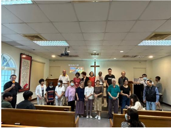
重陽節發放敬老禮金