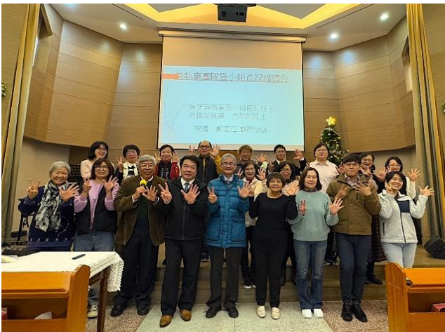
為長執與小組長同工團隊祝福