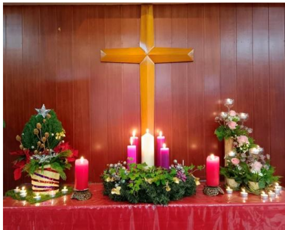
中華基督教信義會復興堂平安夜音樂會