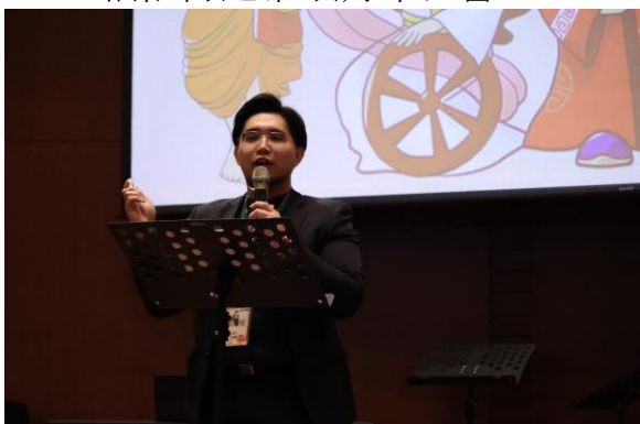
柏佑傳道帶領聚會、傳講福音