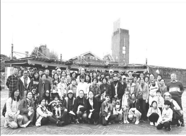
宜蘭傳藝中心一日遊 1