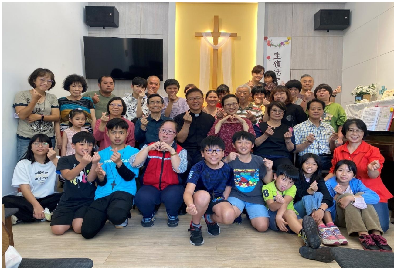
113 年 3 月 31 日復活節