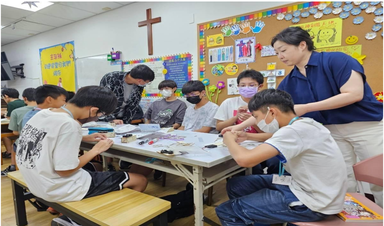
113年5月青少年科學營