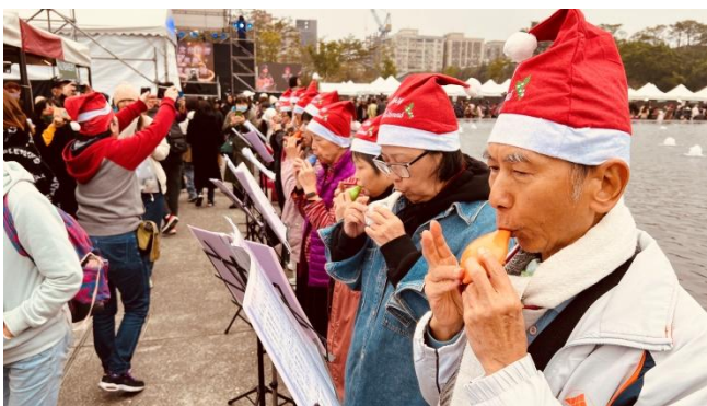
臺北市府社會局補助辦理社區照顧關懷據點輔導考核計畫(114年) 據點名稱：財團法人台北市中華基督教信義會(復興堂)