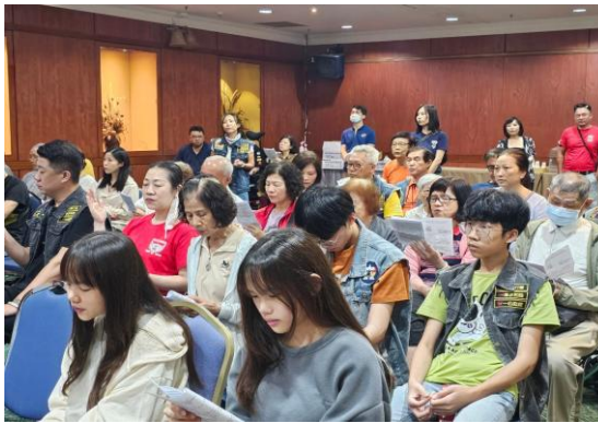
春季退休會（重機福音團契一同參與）