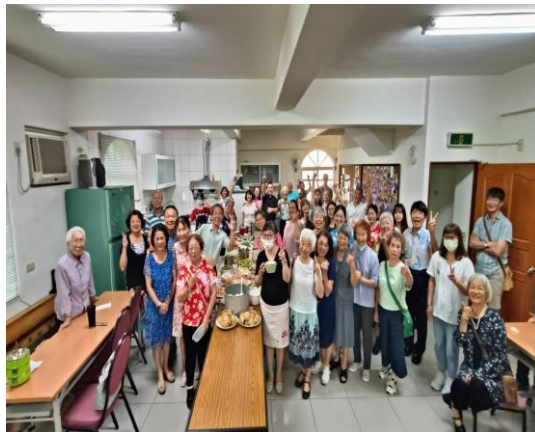
客家聖樂團與本堂會友愛宴