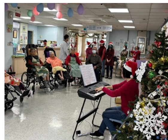
栗園護理之家聖誕佈道