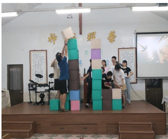
週六英文班特別活動