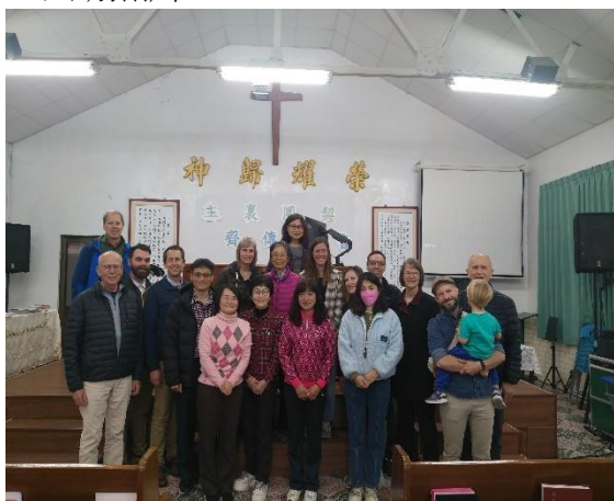
北美路德信友神學院團隊來訪