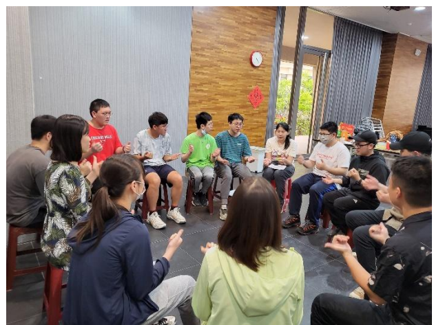
恩禮 Young 青年聚會