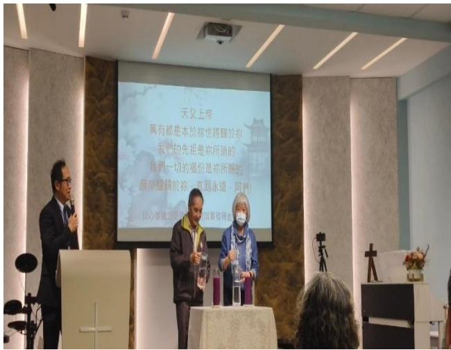
基督教清明敬祖孝親大會